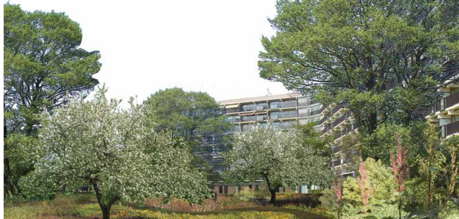
IMPRESSIE FOREST GARDEN OMMOORD (UIT: RUIMTE VOOR STADSLANDBOUW IN ROTTERDAM).